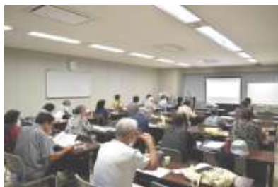
医療・介護クラス